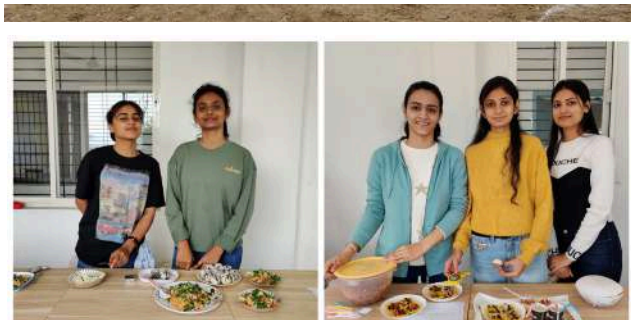
Food without Flame