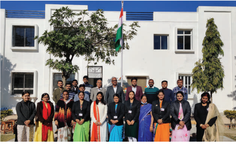
Republic Day Celebration